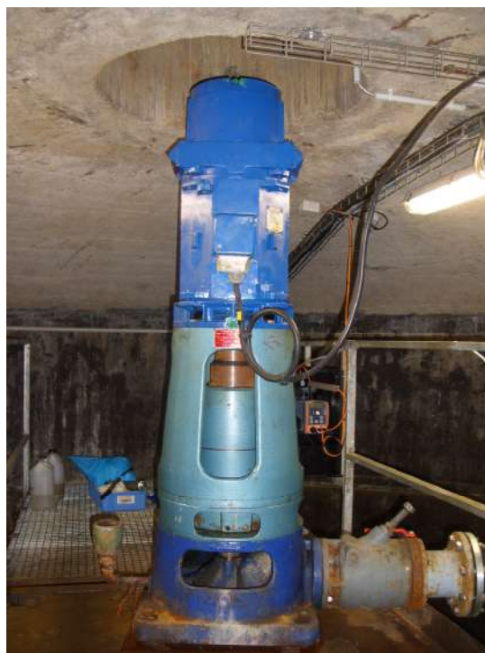
Pompe du forage "Krummrech"

Le commissaire enquêteur a tenu quatre permanences en mairie d'Oermingen et deux en mairie de Kalhausen. Le dossier était consultable dans les deux mairies pendant toute la durée de l'enquête.