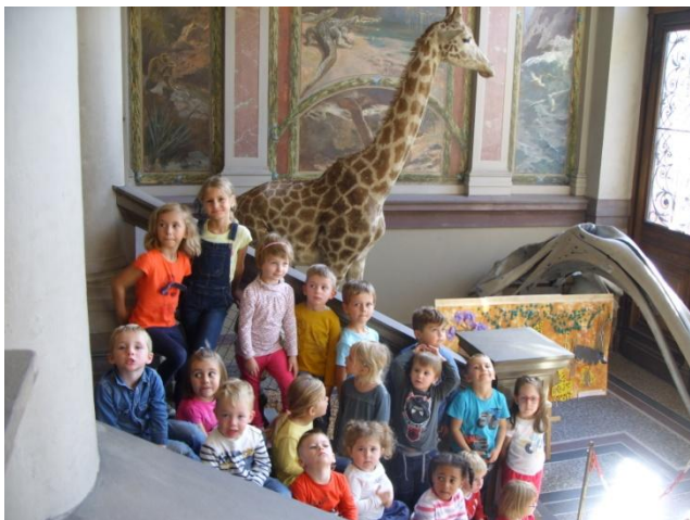
Sortie au musée zoologique de Strasbourg le vendredi 28 septembre 2018 classe des P.S./M.S./G.S