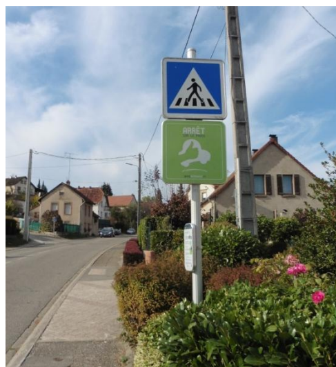
Et Route de Herbitzheim devant le Crédit Mutuel