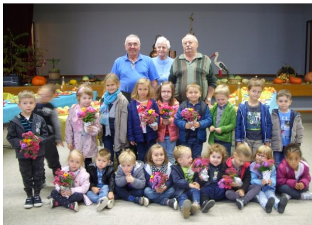
Visite de l'exposition arboricole à Oermingen le lundi 1 octobre 2018 classe des P.S./M.S./G.S.