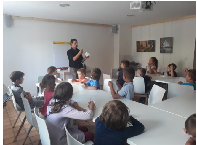
Activité à la Villa : fabrication d'un cadran solaire