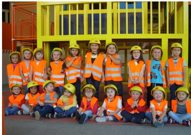
Sortie au Vaisseau à Strasbourg le vendredi 28 septembre 2018 classe des P.S./M.S./G.S.