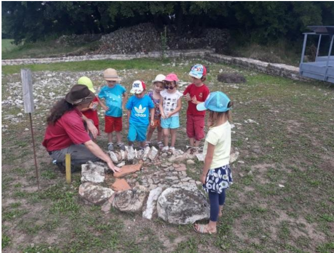
Sortie sur le site archéologique Gallo-Romain à Dehlingen. Groupe des petits