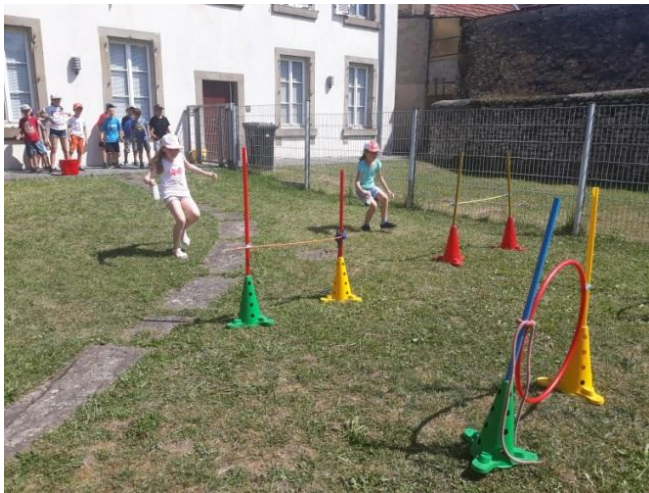
Jeux d'eau avec parcours d'obstacle