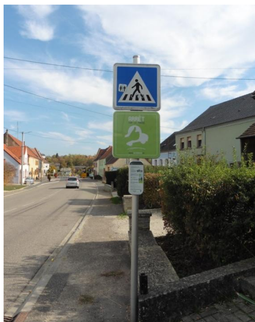
Arrêt Rezo Pouce Route de Herbitzheim A Oermingen devant l'abri bus