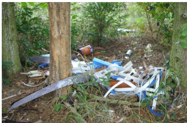
Décharge sauvage découverte par les enfants lors de l'opération « Nettoyons la Nature »