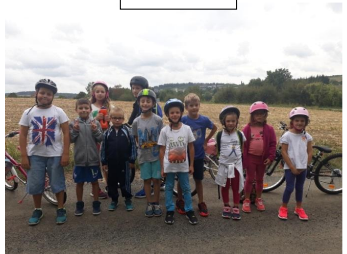
Sortie vélo avec le groupe des grands