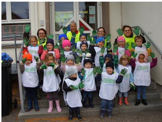
Opération Nettoyons la Nature le mardi 2 octobre à Oermingen classe des P.S./M.S./G.S.